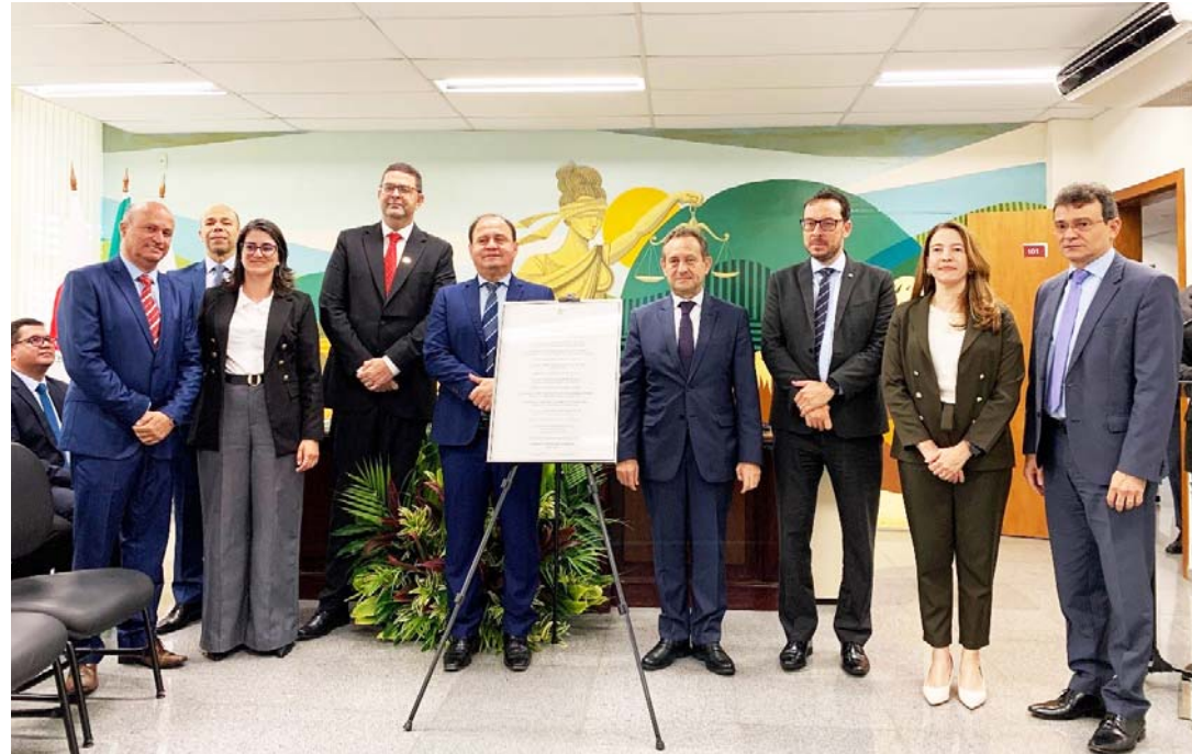
A instalação é fruto de acordo de cooperação técnica firmado com o Tribunal de Justiça de Minas Gerais