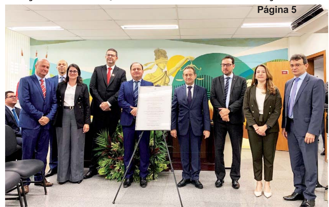
A instalação é fruto de acordo de cooperação técnica firmado com o Tribunal de Justiça de Minas Gerais