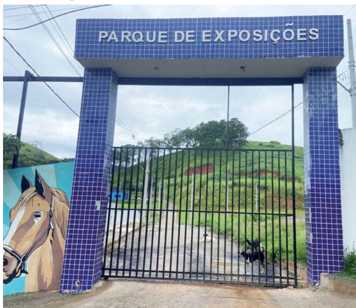
Fachada do Parque de Exposições

inclusive, caratinguenses que vivem fora da cidade. “Será uma oportunidade para todos os caratinguenses que estiverem fora visitarem Caratinga. O feriado do dia 19 vai cair numa sexta-feira, então teremos sexta, sábado, domingo, segunda e terça – vários dias de festa para nossa cidade”, pontuou.