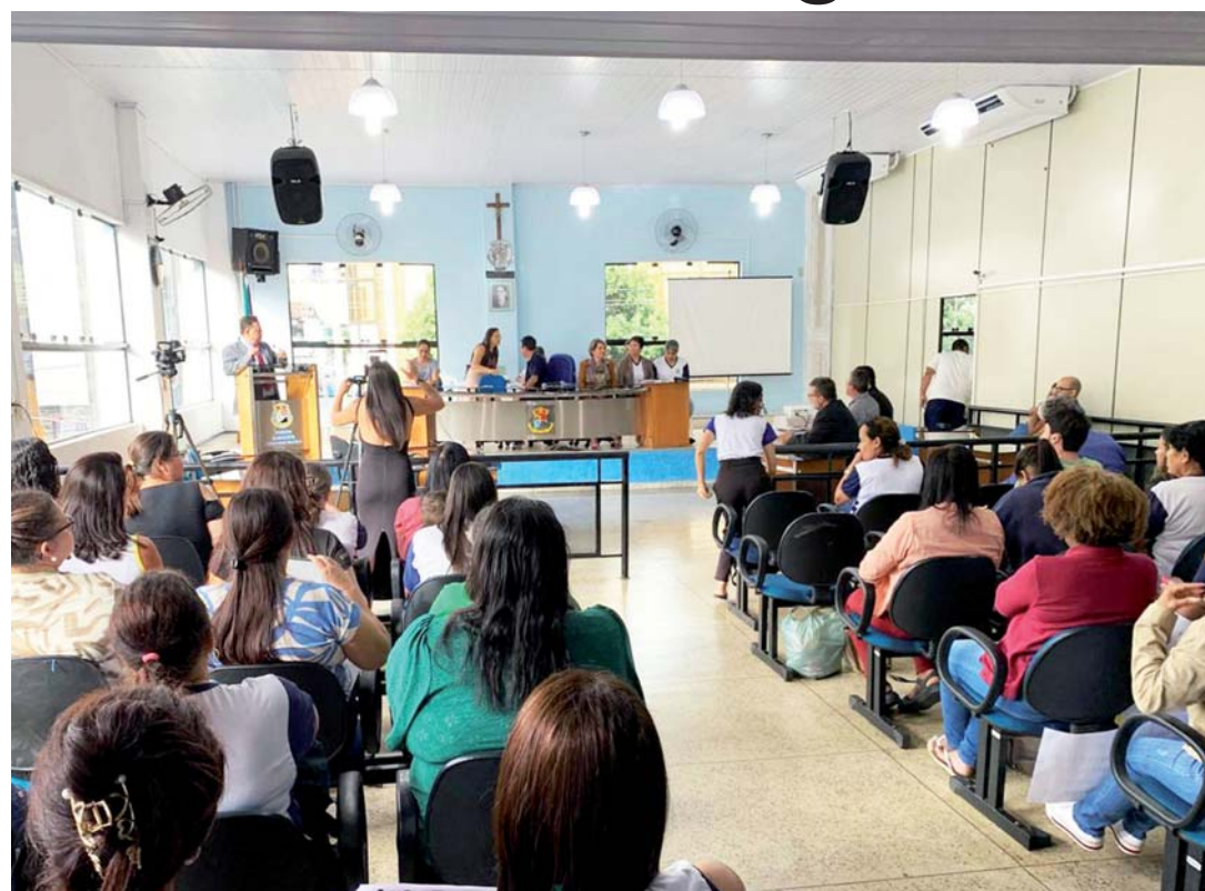
Câmara sediou audiência pública para discutir o reconhecimento das monitoras da rede municipal de ensino como profissionais do magistério