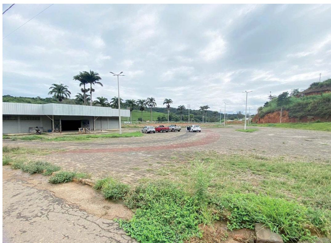
Área do Parque será preparada para receber o evento