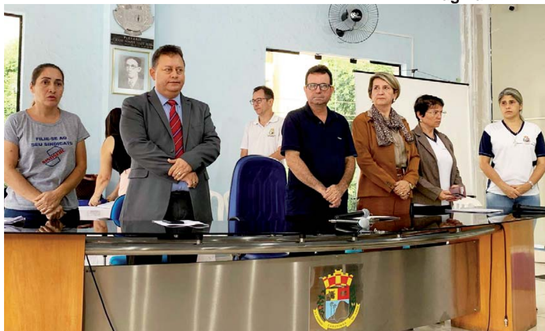
Mesa diretora da audiência