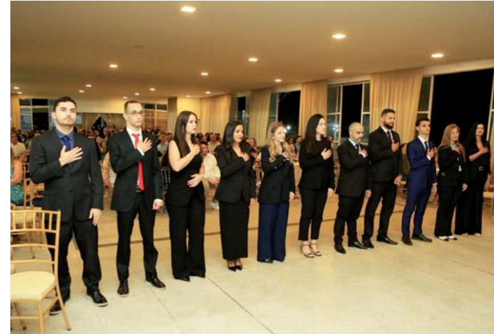
Novos advogados prestando juramento perante a ordem