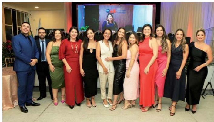
Presidentes das Comissões OAB Caratinga