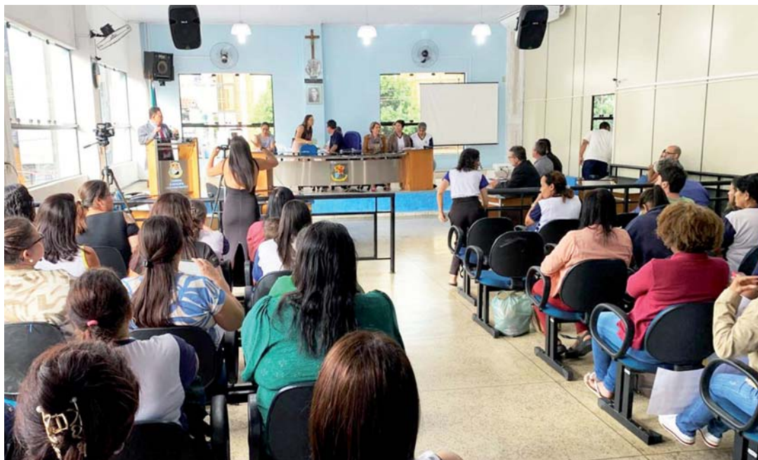
Câmara sediou audiência pública para discutir o reconhecimento das monitoras da rede municipal de ensino como profissionais do magistério