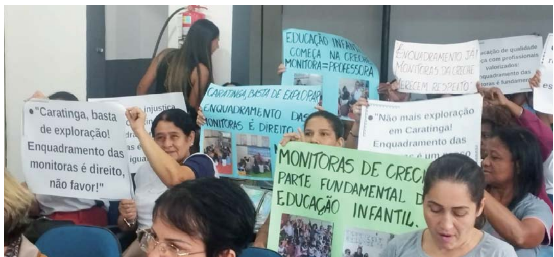
Monitoras fizeram suas reivindicações