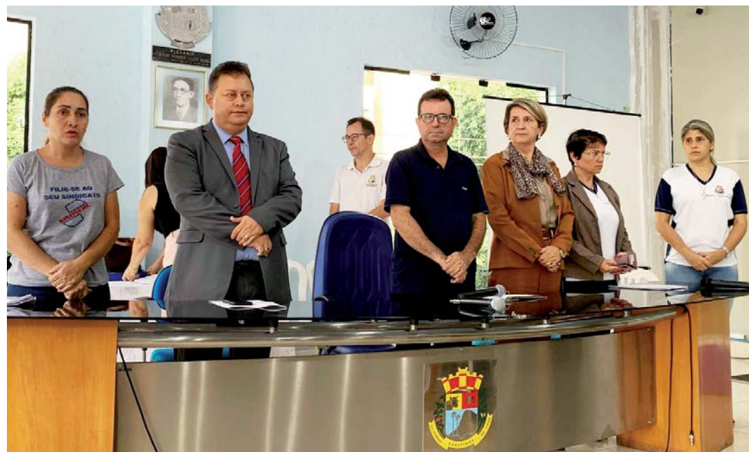
Mesa diretora da audiência