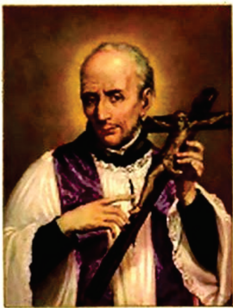
SÃO FRANCISCO DE JERÔNIMO

Certa vez pregando aos fiéis uma mulher começou a molestá-lo, dizendo que a questão do inferno era uma mera asneira. O santo então disse no seu púlpito de oratória: “Ai de ti, filha, se resistes à graça! Não passarão oito dias, sem que Deus te castigue”. A mulher muito má não se preocupou com essas palavras e continuou a murmurar, e fazer seus pecados. Passaram oito dias os vizinhos começaram a bater as suas janelas e o santo perguntando o que houve, lhe disseram que a tal mulher acabara de morrer, de repente. “Morreu? Disse o santo. Pois bem, agora nos diga de que valeu zombar do inferno; vamos perguntar-lhe”. Os ouvintes percebendo que era uma graça extraordinária com tal inspiração foram acompanhar o santo, e chegando na sala onde estava, parecia, conforme os testemunhos, que era uma câmara ardente de fogo. O santo descobre o rosto da mulher e lhe pergunta: “Onde você está?”. Com um ar de desespero, de medo, pavor, com uma cor horrível no rosto, a defunta abre os olhos e diz com uma voz terrível: “No inferno! Eu estou no inferno”. E depois cai realmente morta. O seu dia é 11 de Maio.